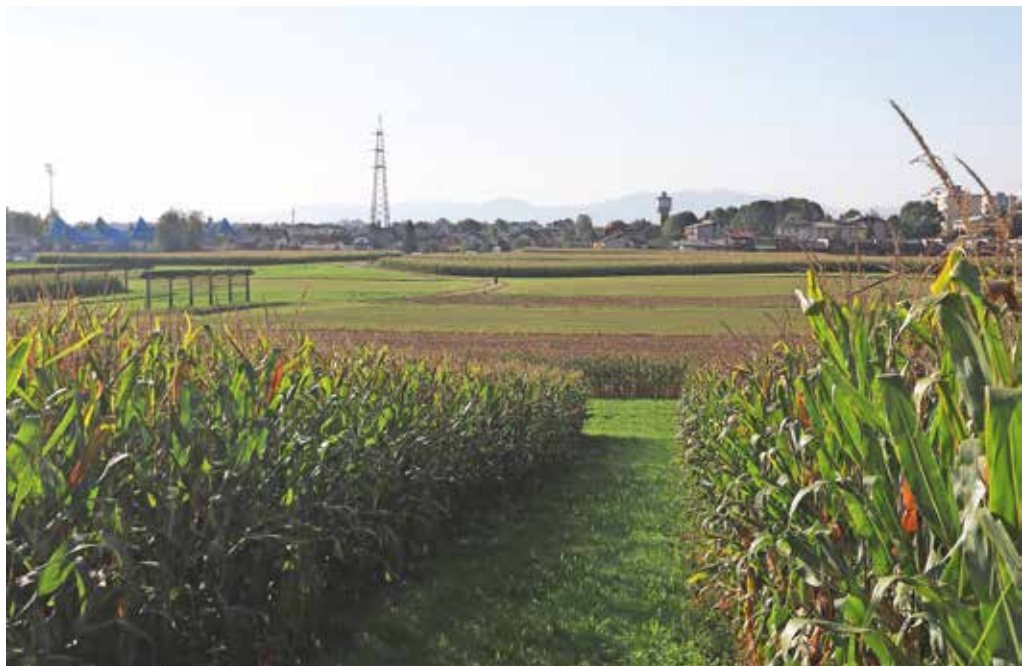
Rupovško polje

3. Kranju in KS Vodovodni stolp primanjkuje naravnih zelenih površin, kjer se prebivalci rekreirajo. Na Rupov-