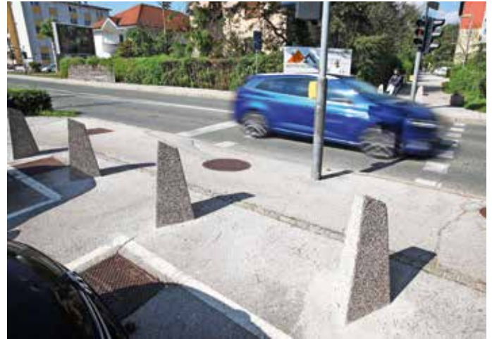
Betonski stebrički pri vrtcu Janina