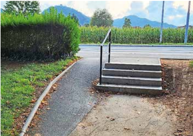
Obnovljene stopnice v Šorlijevi ulici

Krajevna skupnost Vodovodni stolp je v okviru 8. člena Odloka o kriterijih in merilih za sofinanciranje krajevnih skupnosti v Mestni občini Kranj, ki krajevnim skupnostim zagotavlja sredstva za lastne investicije, letos izvedla postavitev betonskih stebričkov pri vrtcu Janina, na Kebetovi in Begunjski ulici ter obnovo stopnic na naslovu Šorlijeva ulica 3–4. Načrtujejo tudi postavitev stacionarnega radarja na Cesti Kokrškega odreda.