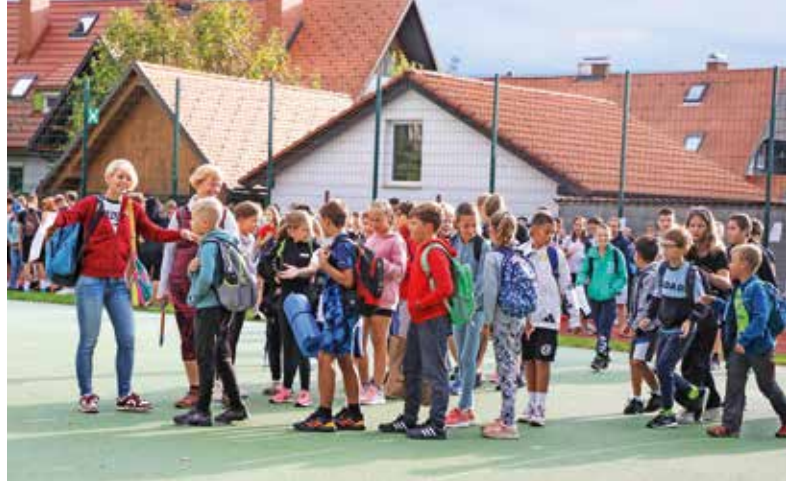
Prvi šolski dan se je začel na zunanjem igrišču.

Nekaj sredstev za šolski sklad so zbrali tudi s 1. prireditvijo Jenkovi talenti, ki 24. maja potekala na gradu Khislstein. Na njej so učenke in učenci predstavili svoje talente in tudi na ta način razvijali pozitivno samopodobo. »Dogodek je bil zelo